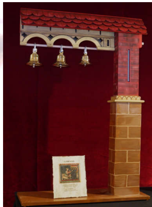
Campanil, miniatura de las CSM de Alfonso X el Sabio, reconstrucción practicada por Vicent Ferrús