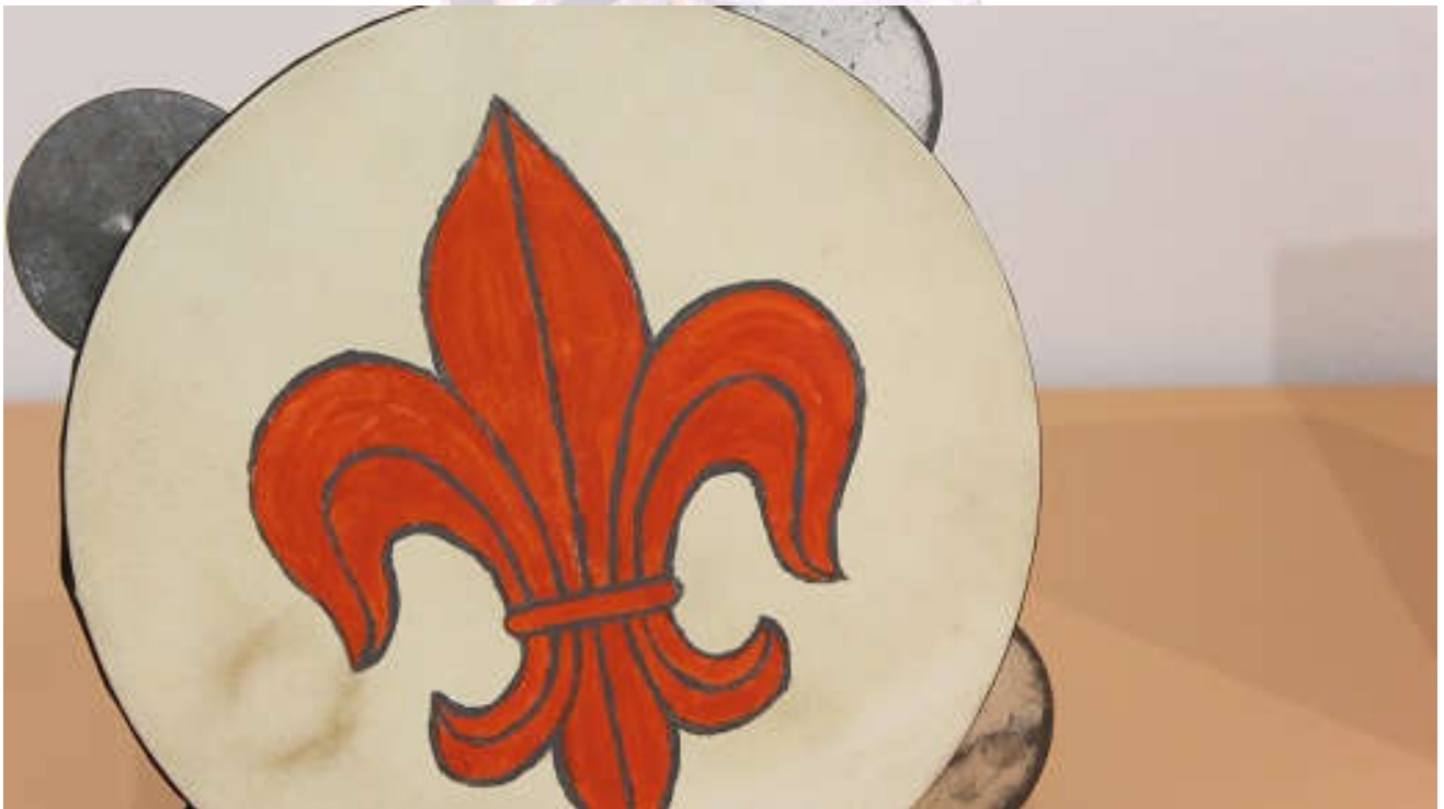
Haggadá Hispano Morisca. Último cuarto del s. XIII o primero del s. XIV. Miriam toca una pandereta con una flor de lis roja dibujada en ella. Como símbolo de poder, soberanía, honor, lealtad, y también de pureza de cuerpo y alma. La acompañan dos mujeres, tocando tablillas y “pitos”. Reconstrucción Víctor Barral.