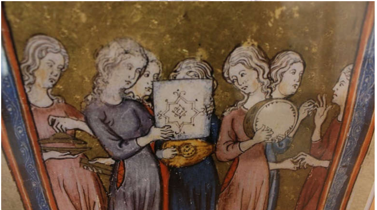
Golden Haggadah, siglo XIV (Libro judío para la Pascua). Reconstrucción de Jota Martínez